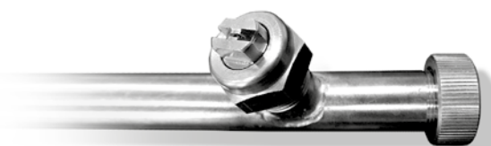
New designed rinse precision nozzles

Предлагаем Вам 8 моделей линии модульных конвейерных посудомоечных машин new green line RACK и широчайший спектр аксессуаров и компонентов, позволяющих выбрать наиболее подходящий вариант, исходя из потребностей любой профессиональной кухни: отныне все машины оснащены новой двойной зоной ополаскивания, включающей систему предварительного ополаскивания с насосом с рукавами предварительного ополаскивания и соплами новой разработки, которые обеспечивают оптимальное распределение воды и смыв всех остатков мощного средства с посуды перед ее попаданием в зону окончательного ополаскивания; система ополаскивания чистой водой имеет новую структурную модель разбрызгивания с рукавами ополаскивания новой разработки и специальными соплами высокой точности, которые обеспечивают превосходную гигиенизацию при меньшем потреблении воды. Новая двойная оптимизированная система ополаскивания и сопла новой технологии позволяют получить струю точно на посуде, сокращая потребление воды с 30% до 53% на некоторых моделях, а также позволяют значительную экономию химических средств и потребления энергии, совместно с преимуществом более низкой установленной мощности. Таким образом, создаются новые возможности продаж и замены старых существующих машин, благодаря быстрой окупаемости инвестиций, обеспечиваемой значительной экономией эксплуатационных расходов!